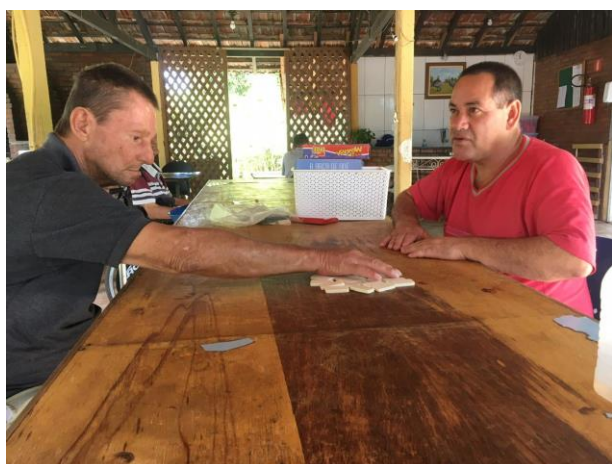
Oficina de pintura MDF 24/05/2021

Atividades livres como Dominó e caça palavras 02/06/2021