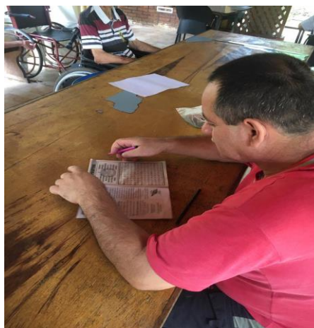
Aniversariante do mês 28/06/2021