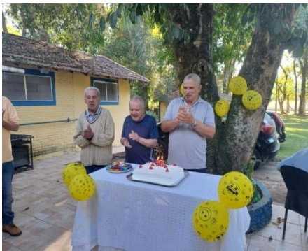
Atividade realizada em 18/06/24