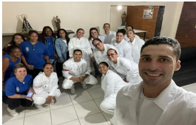
Atividade realizada em 25/04/24

Realizamos a capacitação no Mês de Abril