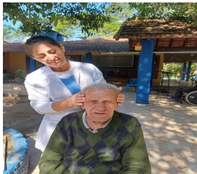
Atividade realizada em 13/06/24