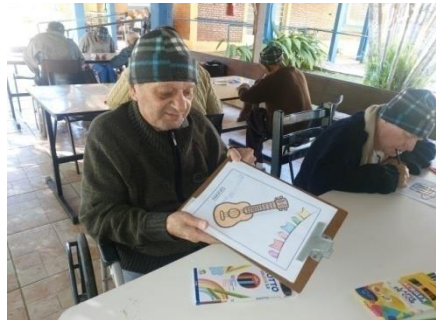
Atividade realizada em 08/06/24