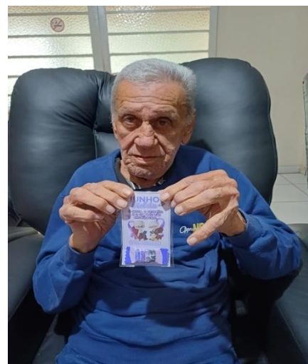
Atividade realizada em 15/06/24