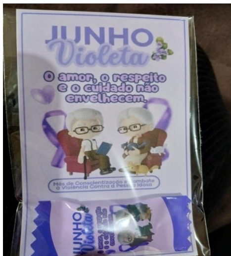
Atividade realizada em 15/06/24