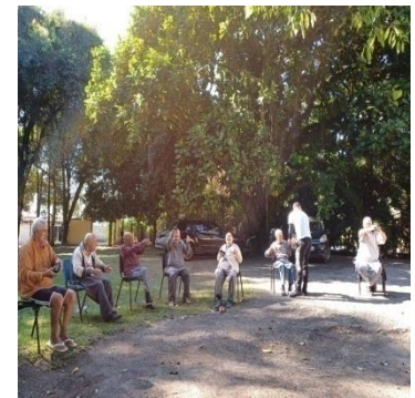
Atividade realizada em 19/06/24