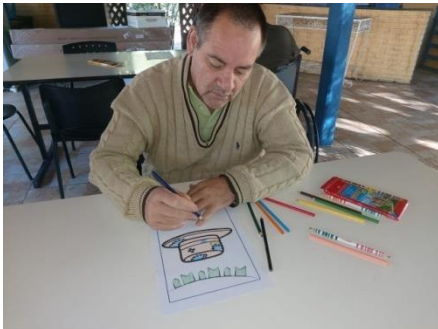
Atividade realizada em 08/06/24