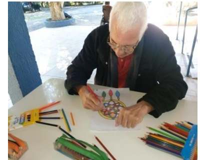
Atividade realizada em 08/06/24