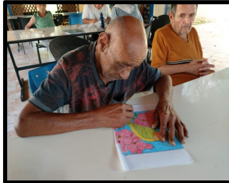
Atividade realizada em 16/09/24