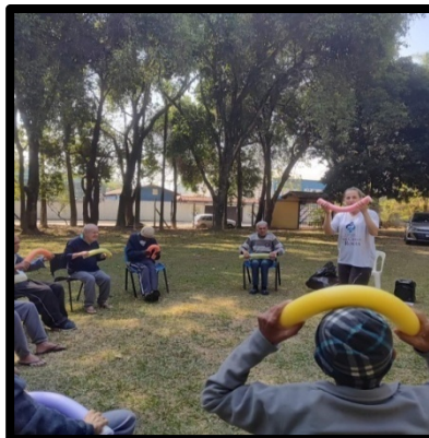
Atividade realizada 19/09/24