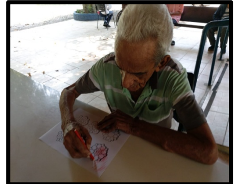
Atividade realizada em 16/09/24