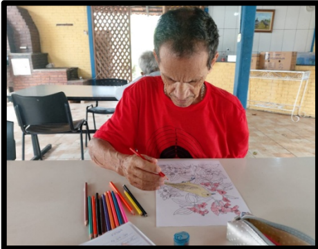
Atividade realizada em 16/09/24