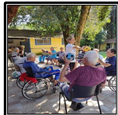
Atividade realizada em 03/04/24