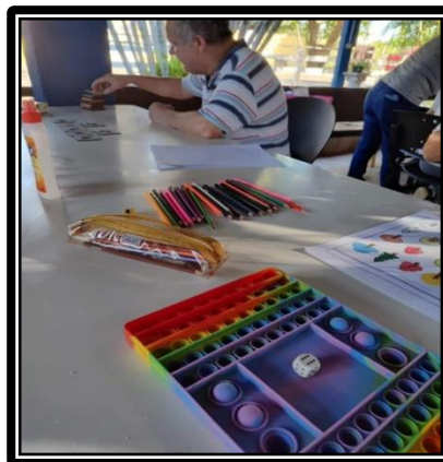
Atividade realizada em 08/04/24