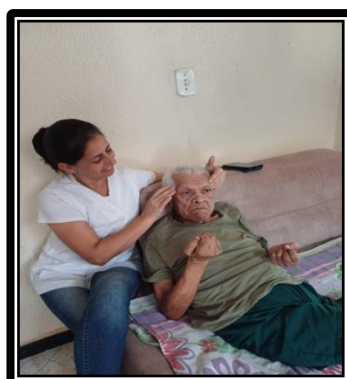
Atividade realizada em 10/04/24