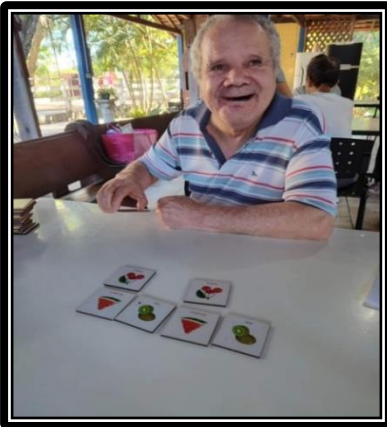
Atividade realizada em 08/04/24