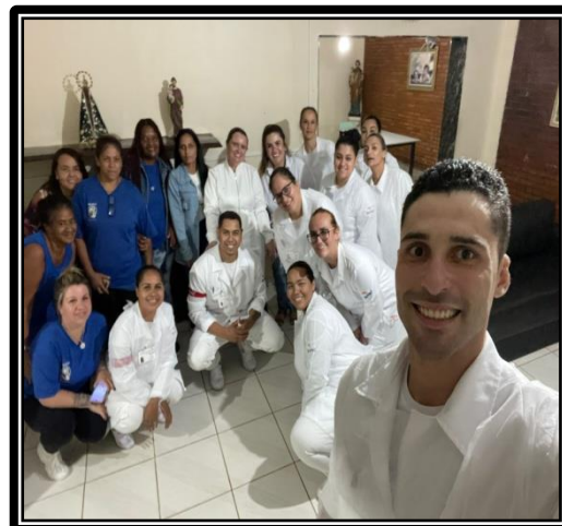
Atividade realizada em 25/04/24