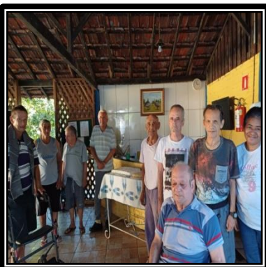
Atividade realizada em 29/04/24