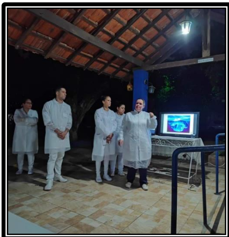
Atividade realizada em 25/04/24