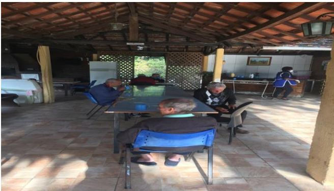
Refeições em grupos reduzidos.