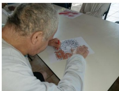
Atividade realizada em 07/10/24