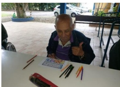
Atividade realizada em 07/10/24