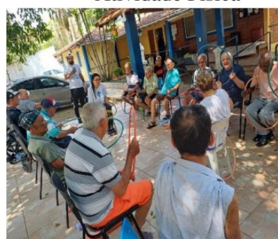
Atividade realizada em 02/10/24