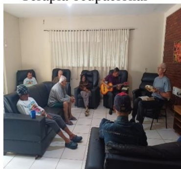
Atividade realizada em 29/10/24