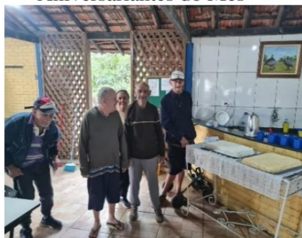
Atividade realizada em 28/10/24