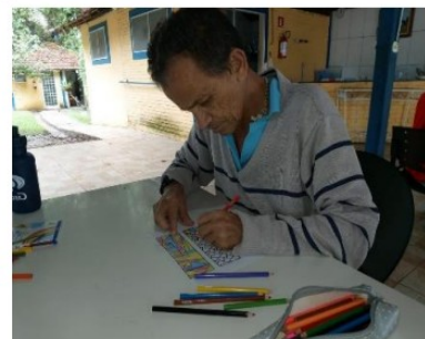
Atividade realizada em 07/10/24