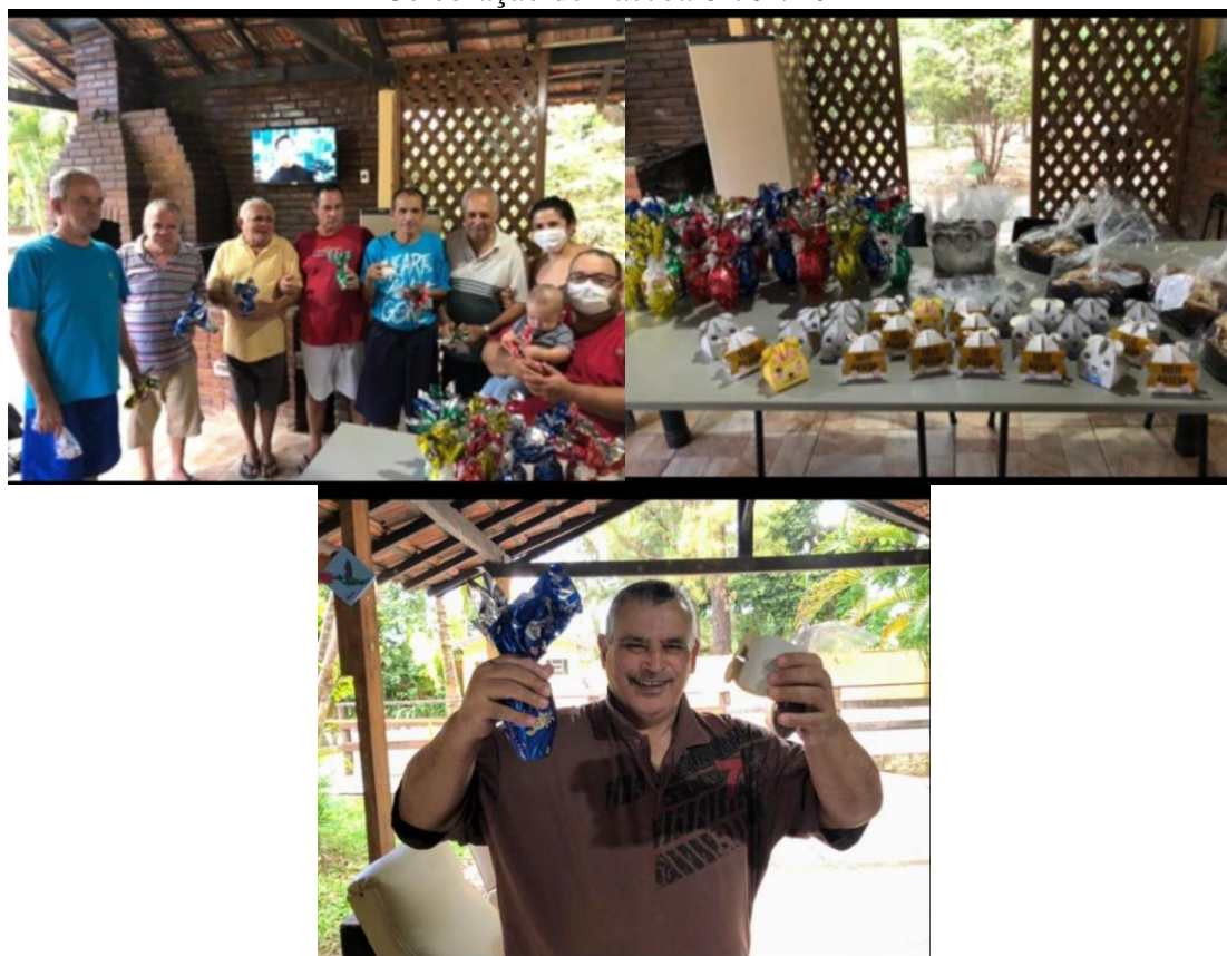
Celebração de Páscoa 04/04/2021

IMPACTO SOCIAL: Desenvolvimento do usuário, como sujeito de direitos e deveres, autônomo e comprometido com a cidadania.