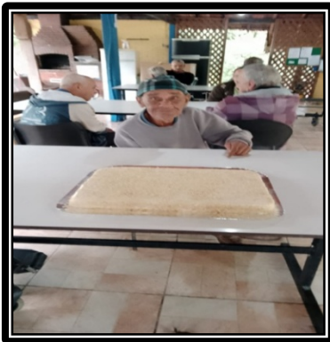
Atividade realizada em 27/05/24