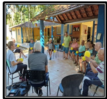
Atividade realizada em 22/05/24