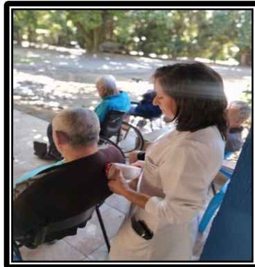
Atividade realizada em 23/05/24