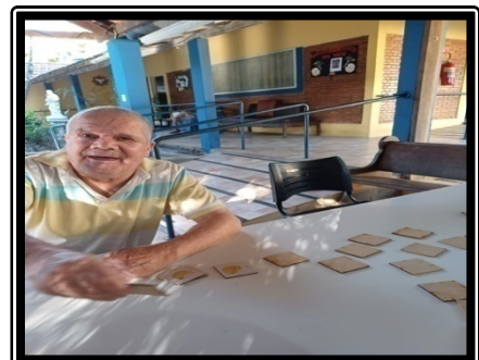
Atividade realizada em 08/05/24