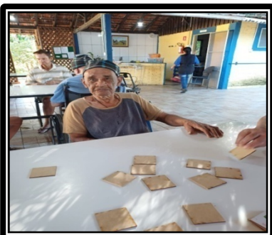
Atividade realizada em 08/05/24