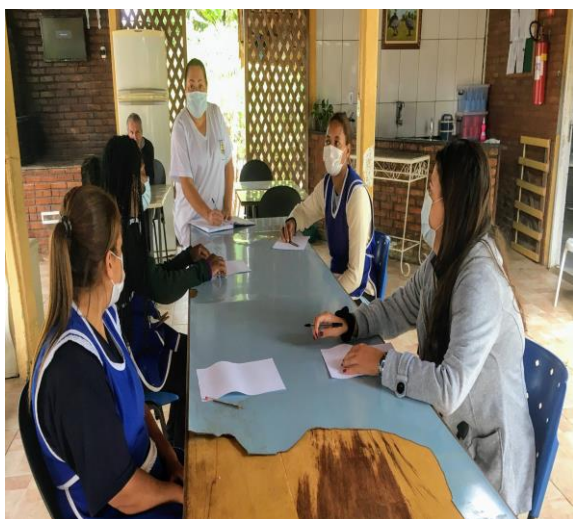
Reunião Técnica 28/09/2020