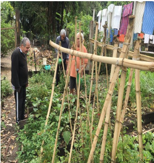
Oficina de Horta 16/09/2020