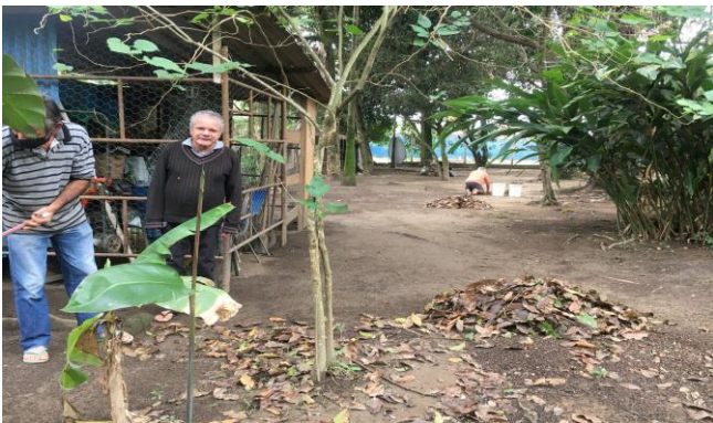
Oficina de Horta 07/10/2020