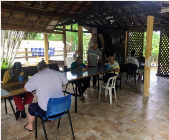
Refeições em grupos reduzidos.