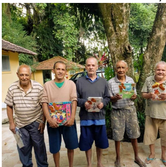
Criação da biblioteca 03/05/2021

IMPACTO SOCIAL: Desenvolvimento do usuário, como sujeito de direitos e deveres, autônomo e comprometido com a cidadania.